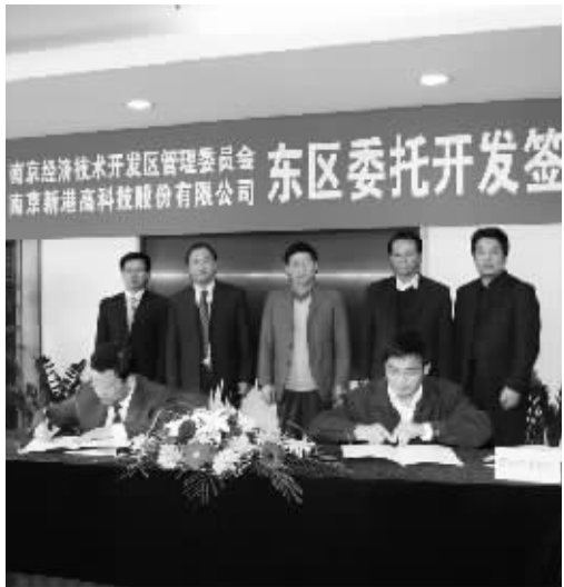
2010年,公司市政业务迎来新的重大发展机遇(图为公司与南京经济技术开发区管委会签订30亿元的开发区东区《委托开发合同》)

未来南京高科将稳步发展市政、房地产等业务,构筑区域开发、建设、运营及配套综合服务的产业链,打造城市运营的综合实力,同时充分发挥“上市公司、高科新创、高科科贷”三大平台作用,在股权投资业务形成“投资-培育-退出”的良性发展机制,为公司可持续发展奠定坚实基础。公司还将进一步强化价值管理,力求在投资回报、运营能力、资产规模、企业品牌等方面做到价值优、实力强、规模佳、品牌响,成为更加卓越的城市运营商和价值管理者。(李文)