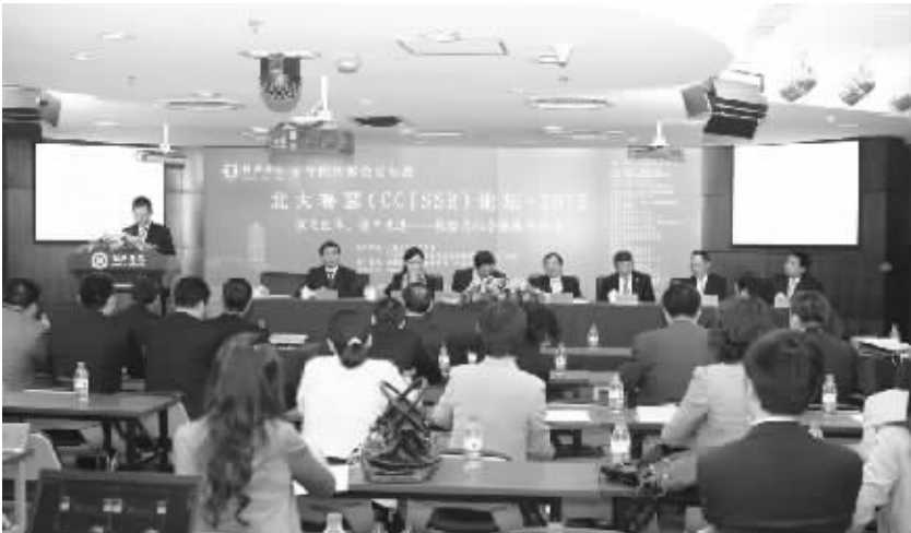
北大赛瑟 (CCISSR) 论坛·2012大会演讲