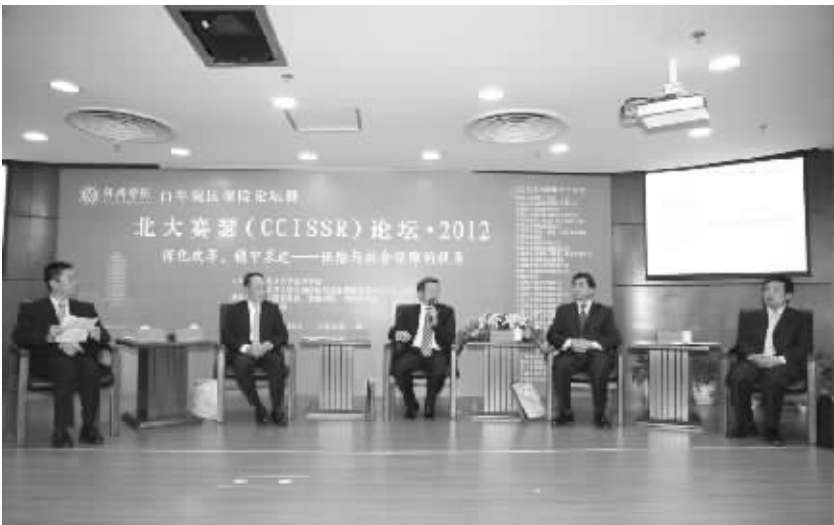
北大赛瑟 (CCISSR) 论坛·高层对话