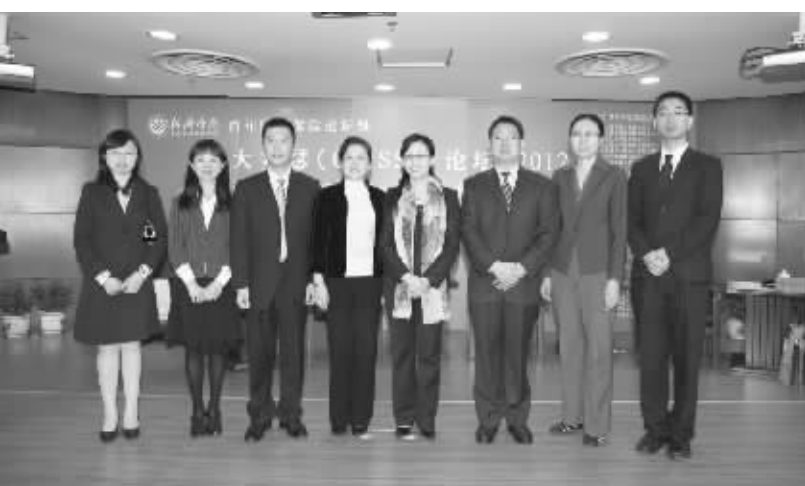
北京大学中国保险与社会保障研究中心 (CCISSR) 执行机构负责人会场合影

自成立以来, 中心秉承北京大学“爱国、进步、民主、科学”的校训精神, 以搭建政产学研交流沟通平台、推进理论研究与知识创新为宗旨, 通过举办一系列学术研究和交流活动, 为中国保险业发展和社会保障制度改革做出了积极的贡献。