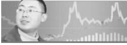
□本报记者 王亚宏 伦敦报道

俗话说一寸光阴一寸金，虽说每盎司黄金的价格已经涨到1400美元以上，但和时间相比，金价却算不上什么，因为再过两周整个英国将进入夏令时，时间将往前拨快一小时。此前，很多人曾讨论要不要往前拨两个小时，这样每年能省出上百亿英镑。调快两个小时“超级夏令时”，意味着英国的钟摆将第一次和欧洲大陆同步。光是想想英国富时100指数将和法国Cac40指数和德国Dax指数同时开启关闭，光是节省出的大量时间和人力成本，就足以让金融城笑开了花。