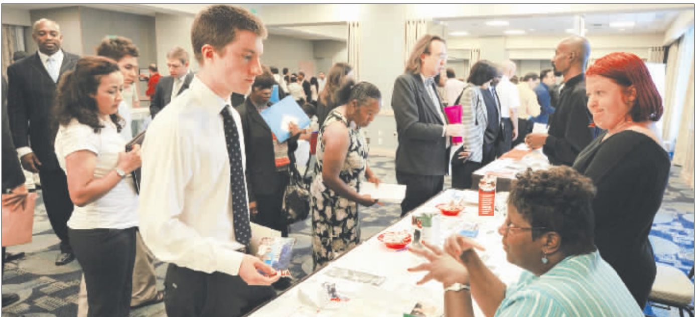
在美国洛杉矶,人们在一次招聘会上寻找工作机会。

高盛首席经济学家哈祖斯2月22日发布报告,上调了美国今明两年的经济增速预测,预计美国经济已经迈入了持续复苏的轨道,未来两年美国GDP将出现3.5%-4%的健康增长,并预计到2012年底美国失业率有望降至8%。