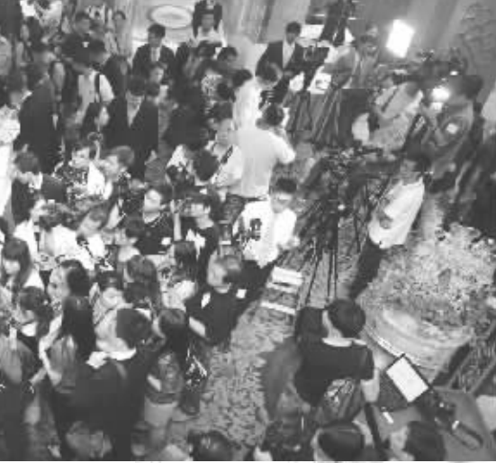
▲特别股东大会的媒体大战。