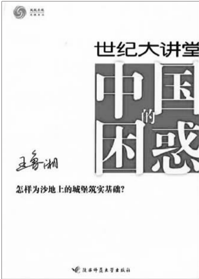
书名:《世纪大讲堂·中国的困惑》 出版社: 陕西师范大学出版社 主持人:王鲁湘