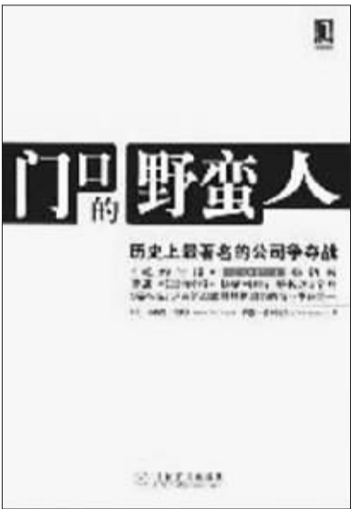
书名:《门口的野蛮人》 出版社:机械工业出版社华章分社

因此，我认为如果把本书的译名改为《奸门揖盗》，会比它的直译书名《门口的野蛮人》更加切合主题，同时也更容易被中国的读者所理解。