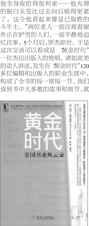
书名:《黄金时代：美国书业风云录》 作者:(美)阿尔·西尔弗曼 出版社:机械工业出版社华章分社

它是一部集口述历史、叙事性史料和作者个人亲历感想于一体的纪实性读物。全书的叙述从美国书业“黄金时代”起源的标志性出版社——法勒·斯特劳斯-吉鲁出版社的创始人罗杰·斯特劳斯开头。罗杰所创立的出版社在50多年里出版的书获得了17项诺贝尔文学奖。年近的作者们在2003年12月纽约最大的一场暴风雪之后前往造访当时已经87岁的罗杰。“看到眼前这个身子单薄、衣着破旧的罗杰我并不感到惊讶。”作者写道，“他的脸上带着一种大病初愈后的灰白色，双眼显得格外突出。但他全身收拾得很利索……他光滑的银白头发表比过去向后梳得更紧了，这令他看起来像是已取胜的斗士牛。”两位老人一面注视着窗外正在铲雪的人们，一面平静地追忆往事。5个月，罗杰辞世。于是这次交谈可以看成是“黄金时代”一位杰出出版人的绝唱。诸如此类的动人讲述，发生在“黄金时代”120多位编辑和出版人的职业生涯中，构成了全书的每一章每一节。我们读到书中大多数的故事和细节，就