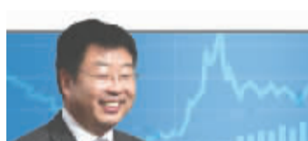
国金证券首席经济学家 金岩石

股市风云变幻,升如抽丝,跌如急雨,8月4日到13日沪指跌幅超过13%,特别是8月12日的暴跌如晴空霹雳,跌得没头没脑。7月的诸多数据数据都出炉了,究竟是哪个数据得罪了股市呢?