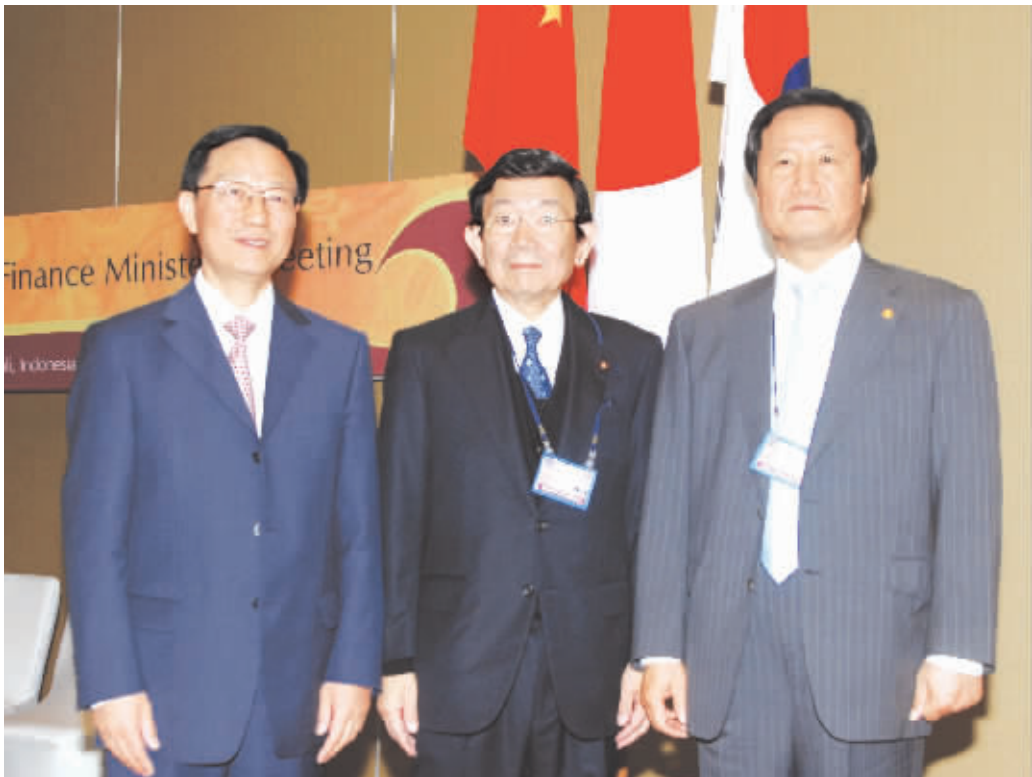
中国财政部部长谢旭人(左)、日本财务大臣与谢野馨(中)和韩国企划财政部长官尹增铉会谈前合影。

北京大学国际关系学院国际政治经济研究中心主任王勇认为，东亚是全世界美元外汇储备最多、美元外汇储备占