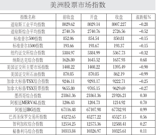
本表数据截至4月16日 22:15