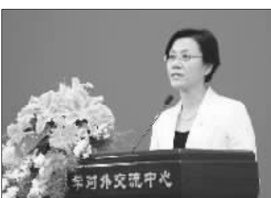
任何事物的发生、发展都有其客观规律性，“肯定一切或者否定一切”、“因噎废食”都不符合科学发展观。我国保险业要认真研究此次金融危机的客观背景，在近期发展中正确处理好以下六对关系。

中心推出的每年一度的“北大赛瑟(CCISSR)论坛”，每周一期的《中国保险报》专栏“北大保险评论”、以及“北大赛瑟(CCISSR)双周讨论会”、《中国保险市场热点问题评析》、“北大赛瑟-英杰华保险研究系列丛书”等已经成为中国保险与社会保障领域的知名学术品牌。2006年，该中心还从北京大学约200家科研机构中脱颖而出，获得“北京大学人文社会科学优秀科研机构”的荣誉称号。