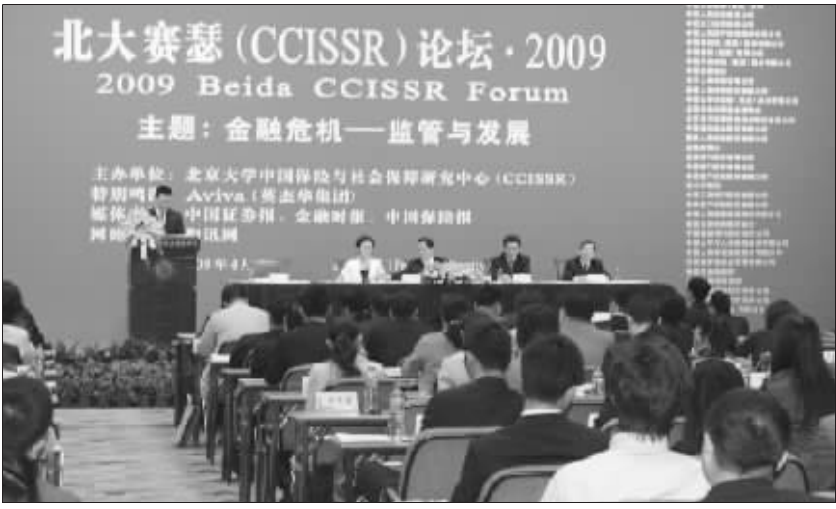
北大赛瑟(CCISSR)·2009论坛大会演讲

金融危机给我国保险业改革发展带来了深刻的启示：第一，保险业发展不能脱离经济社会发展和人民群众的需要。第二，保险创新不能脱离经济金融发展的阶段。第三，保险经营不能背离稳健经营的规律。第四，保险监管不能偏离防风险、促发展和保护被保险人利益的目标。当前，保险业要重点抓好防范保险风险、服务经济社会发展两大任务。第一，应对金融危机，防范化解保险风险，努力维护保险市场稳定。一是高度重视和切实抓好防范化解风险工作。二是积极推动保险业结构调整。三是加强保险市场调控，促进行业平稳增长。第二，支持国家宏观经济政策和重点领域改革，积极为经济社会发展服务。一是加快发展“三农”保险，服务新农村