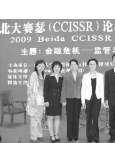
北京大学中国保险与社会保障研究中心执行机构负责人合影

同。在尊重国情的基础上借鉴发达国家的有益经验、汲取教训，仍然应当是今后发展的重要原则之一。