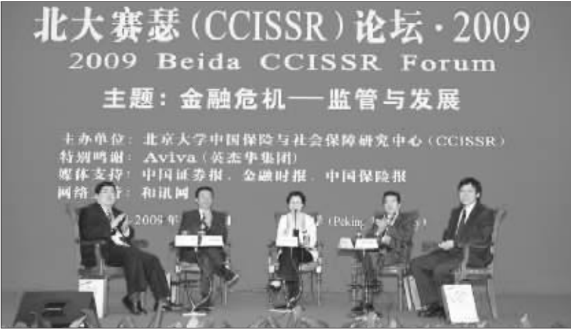
北大赛瑟(CCISSR)·2009论坛高层对话

有大家的认同与大力支持，我们深感庆幸且备受鼓舞。肩负着推动中国保险与社会保障领域的理论创新和实践发展这一充满生机而又任重道远的事业，中心必将继续上下求索、不断奋进。