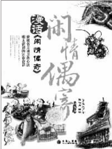
书名:漫话闲情偶寄·饮饕篇 作者:李渔