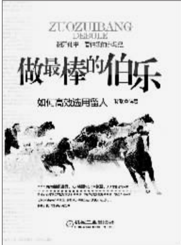
书名:做最棒的伯乐:如何高效选用留人 作者:孙瑞

现代社会“整容”技术高超,很多普通的野马也可以化装成“千里马”,作为伯乐,你如何撕掉那一张张面皮,看清千里马的真面目?企业中的岗位特色各异,也许适合某个岗位的千里马不再需要“声音洪亮,如大钟磐石”类型的,作为伯乐,你如何根据自己的需求寻找到有特殊才能的千里马?市场竞争日益激烈,作为伯乐,你是否做过牵回一匹马之后等着“路遥知马力”,但却因此错过了大好竞争时期的事情?