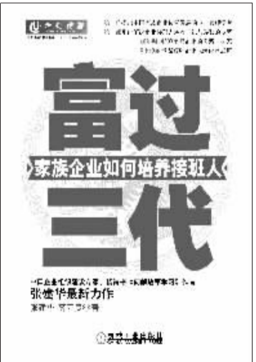
书名:富过三代 作者:张建华 薛万贵 出版社:机械工业出版社

作为国内首部系统研究家族企业接班人培养的图书,《富过三代》扎根于中国企业文化的实际,深入分析了中国企业的成长历程、领导者的心