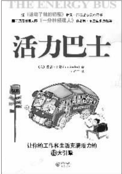
书名:活力巴士 作者:乔恩·戈登 出版社:重庆出版集团、重庆出版社