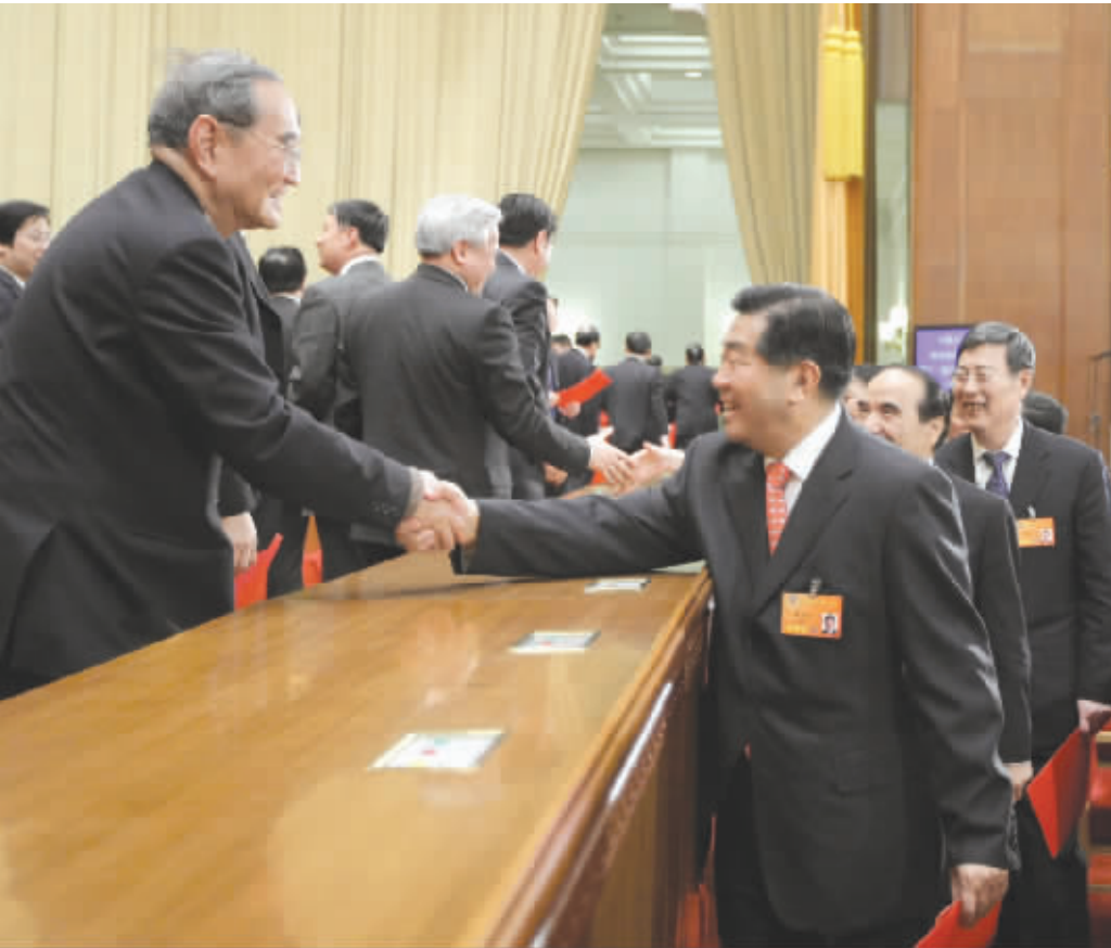
贾庆林当选政协第十一届全国委员会主席后,委员们向他表示祝贺。