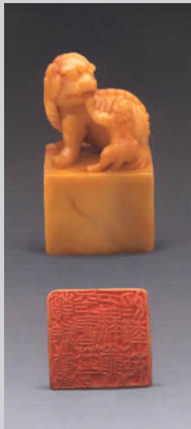
田黄少狮太狮印 上海崇源 上海工美 2007 秋拍品 成交价:112 万元

风险提示: 由于篆刻印章市场的兴起,不排除一些小型拍卖公司也先后增开印章专场。作为收藏投资人,应注意选择在印章方面业绩较为出色的拍卖行,以降低风险。如杭州西泠印社拍卖、匡时国际等拍卖公司。