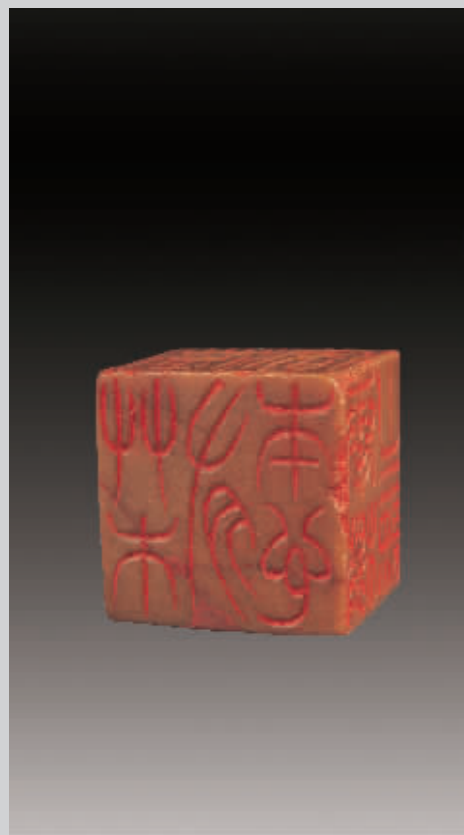
吴熙载刻青田石六面印 杭州西泠印社拍卖 2007秋拍品 估价:48-60 万元