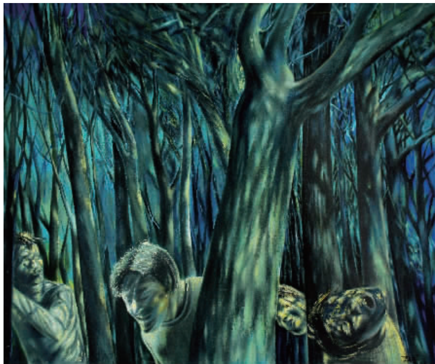
尹朝阳《青春远去·林中嚎叫》北京荣宝 2007 秋拍品 成交价:67.2 万元