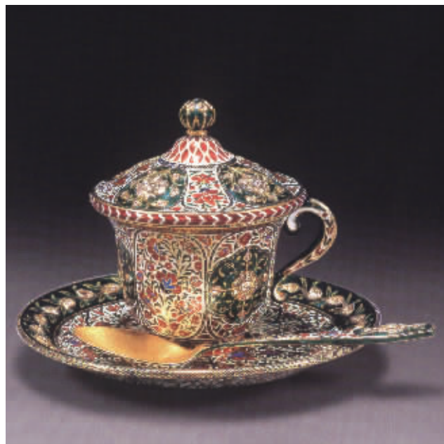
金胎镶钻石嵌珐琅杯盖(四件套)北京长风 2007 秋拍品 成交价:1008 万元