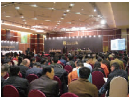
实力雄厚的拍卖公司现场往往座无虚席