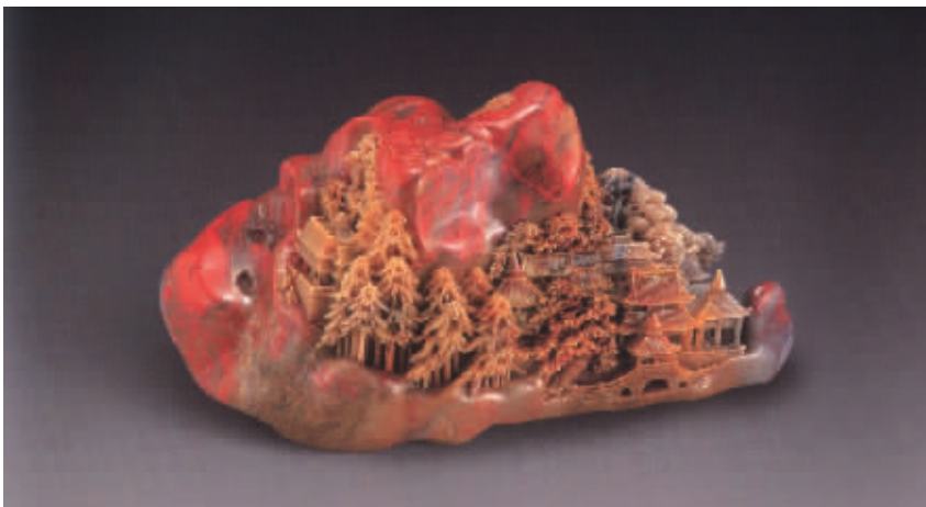
牛克思制 昌化鸡血石雕楼阁山子 北京翰海 2007 秋拍品 成交价:1344 万元

从多年前零散地进入拍卖市场,到今年秋季在各拍卖公司崭露头角的较高价格,装置是否可以成为一只蝴蝶掀起的另一场风浪。