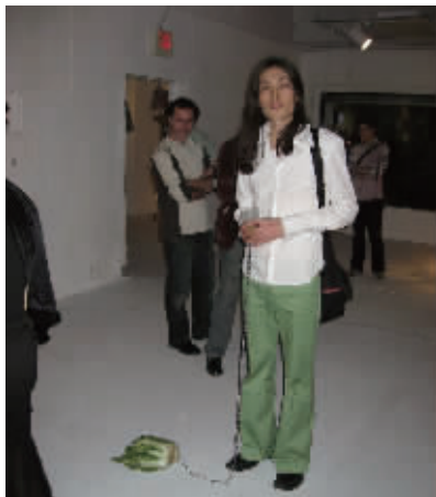
中国艺术家韩冰的行为艺术作品《逗白菜》