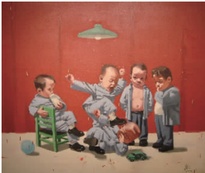
唐志冈《中国童话》2004 布面油画