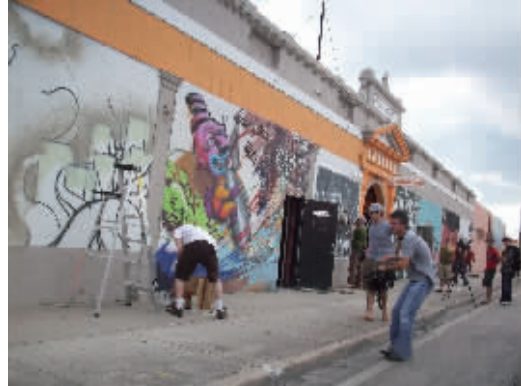
迈阿密博览会期间的街头艺术