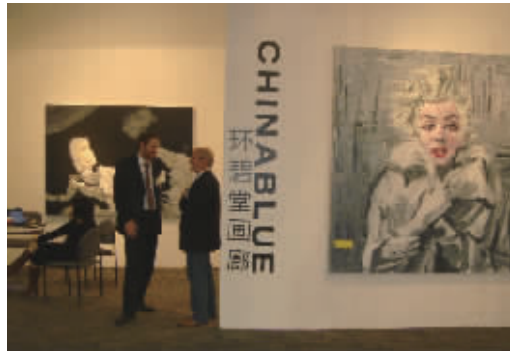
Art Miami 一角 环碧堂画廊