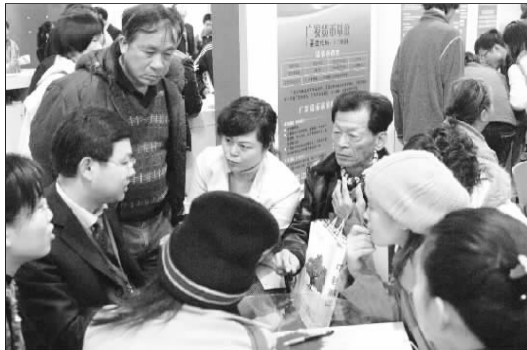
数名市民围着基金公司的工作人员听取理财知识

赶上第三波高峰的投资者显然没有那么“幸运”了,十月初入市的新基金现在多半还在焦灼地等待解套。据统计,10月8日以来,跌幅5%以上的基金