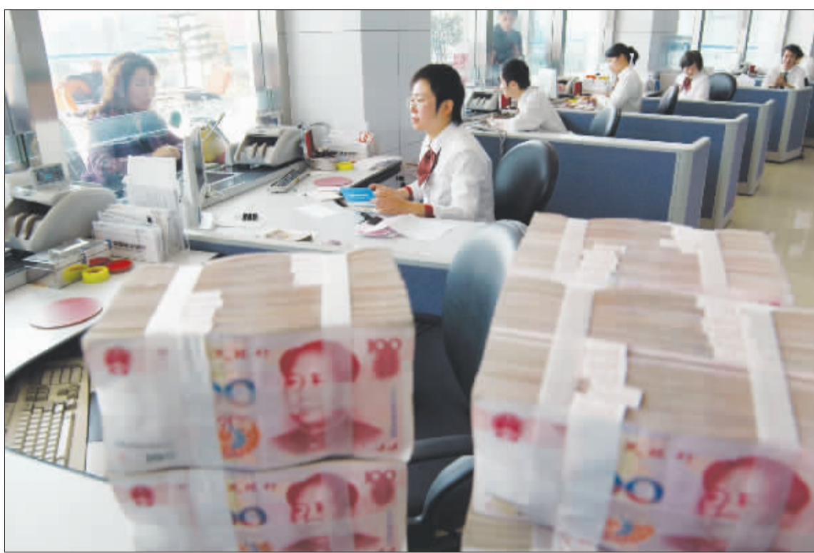
此次上调存款准备金率幅度之大超出市场预期。

其二，时值岁末，贸易顺差仍维持高位运行的格局。而且由于受美国次贷危机、美联储降息和美国经济增速放缓影