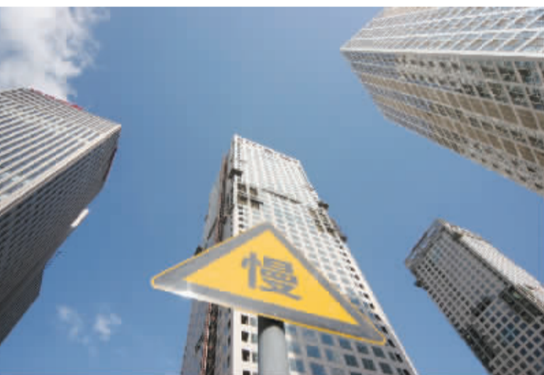
△北京限价房仍然远不可及

杰分析,在销售政策、购买对象、资质监管等技术细节上,如何保证其不重蹈经济适用房覆辙,成为有钱人投资的新对象,更是摆在广大购房者面前的难题。