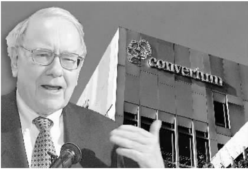
△巴菲特收购康氏再保险北美业务