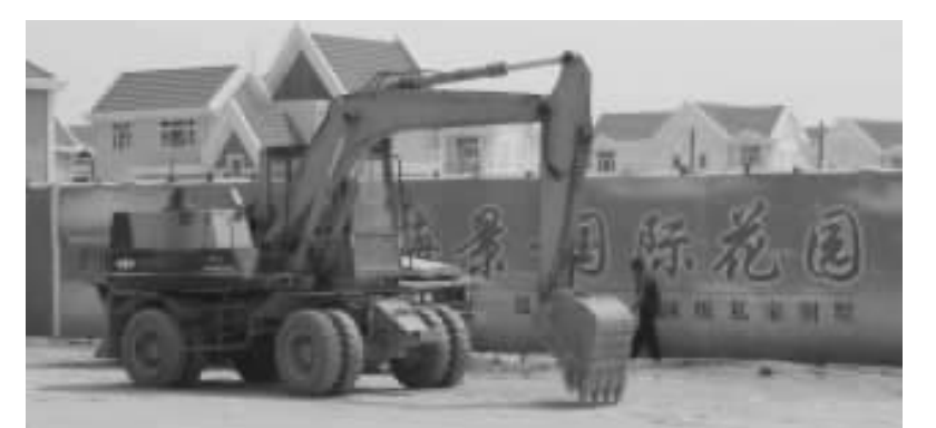
△海景国际花园是金爵地产在泉州的主要开发项目