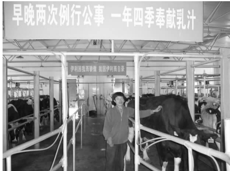
草原乳企认为,如果一定要在乳品包装上加“鲜”字,那么无论是生产常温奶还是巴氏奶的企业,都应拥有这个权利,关键要看是否用鲜奶来做原料。

这引起了常温奶派的强烈不安。令巴氏奶们万万想不到的是,鲜奶标识未能推出,“禁鲜”的《指南》却反而由国家有关部门率先颁布了,这不啻是给了以“鲜”自诩的巴氏奶们当头一棒。