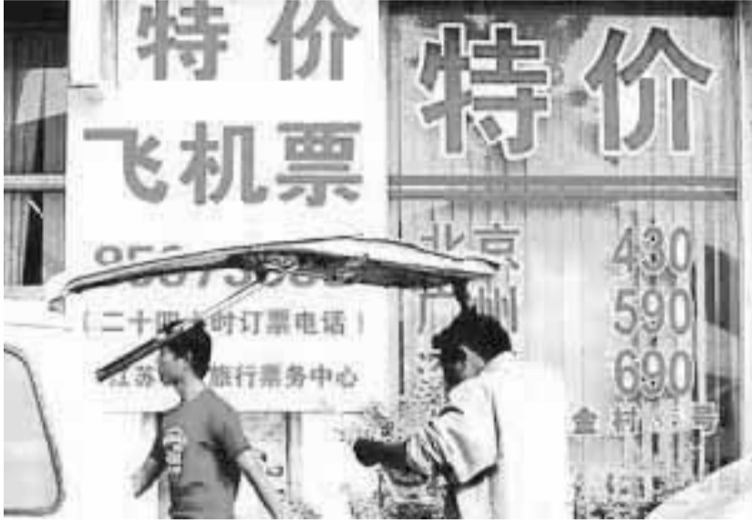
油价高涨和价格联盟真能消灭高折扣机票吗?

民航总局已经否认了出面组织价格同盟的说法,称目前的机票价格属于随着市场行情的变动而发生的正常波动,不存在所谓的“价格联盟”操纵市场问题。眼下机票价格在政府规定的范围内合理波动,没