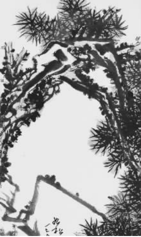
(潘天寿《如松石之寿》立轴 设色纸本 尺寸:137*50.5cm 估价:RMB800,000—1,000,000)