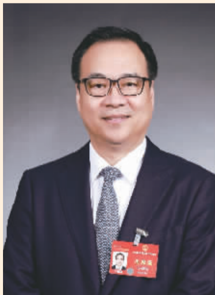
全国人大代表 于清明

全国人大代表、国药控股董事长于清明日前在接受中国证券报记者采访时表示,应加快发展高端医疗器械产业,补强产业链,延伸供应链,实现高端医疗装备自主可控。