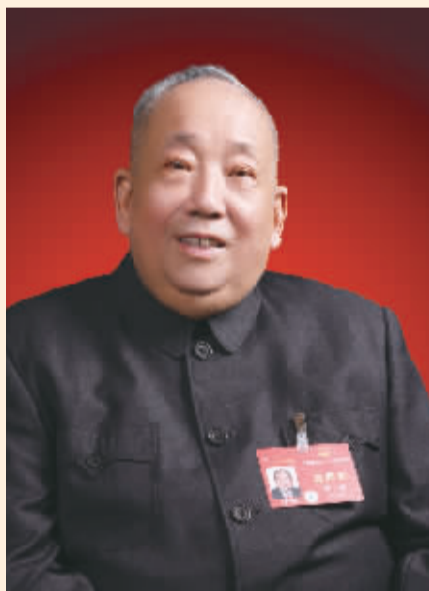
全国人大代表 安康

全国人大代表、华兰生物董事长安康日前在接受中国证券报记者采访时表示,应营造良性融资生态,支持创新生物医药企业发展。