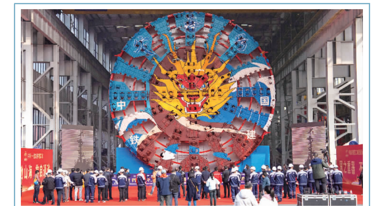
世界最长海底高铁隧道首台盾构机成功下线 1月10日，超大直径盾构机“定海号”在铁建重工长沙第一产业园下线。当日，由中铁十一局和铁建重工联合打造的超大直径盾构机“定海号”在长沙顺利下线，其最大开挖直径14.57米，总重量达4350吨，将投用于世界最长的海底高铁隧道——甬舟铁路金塘海底隧道建设。 新华社图文

1月10日零时起，全国铁路实行新的列车运行图。运用新线资源，开通新增能力，新图的实施将进一步提升路网整体功能。 专家表示，随着铁路、公路路网不断加密，中外航线加快恢复，活跃的客流、旺盛的物流，服务大众生产生活、经济回升向好的功能有望进一步发挥。