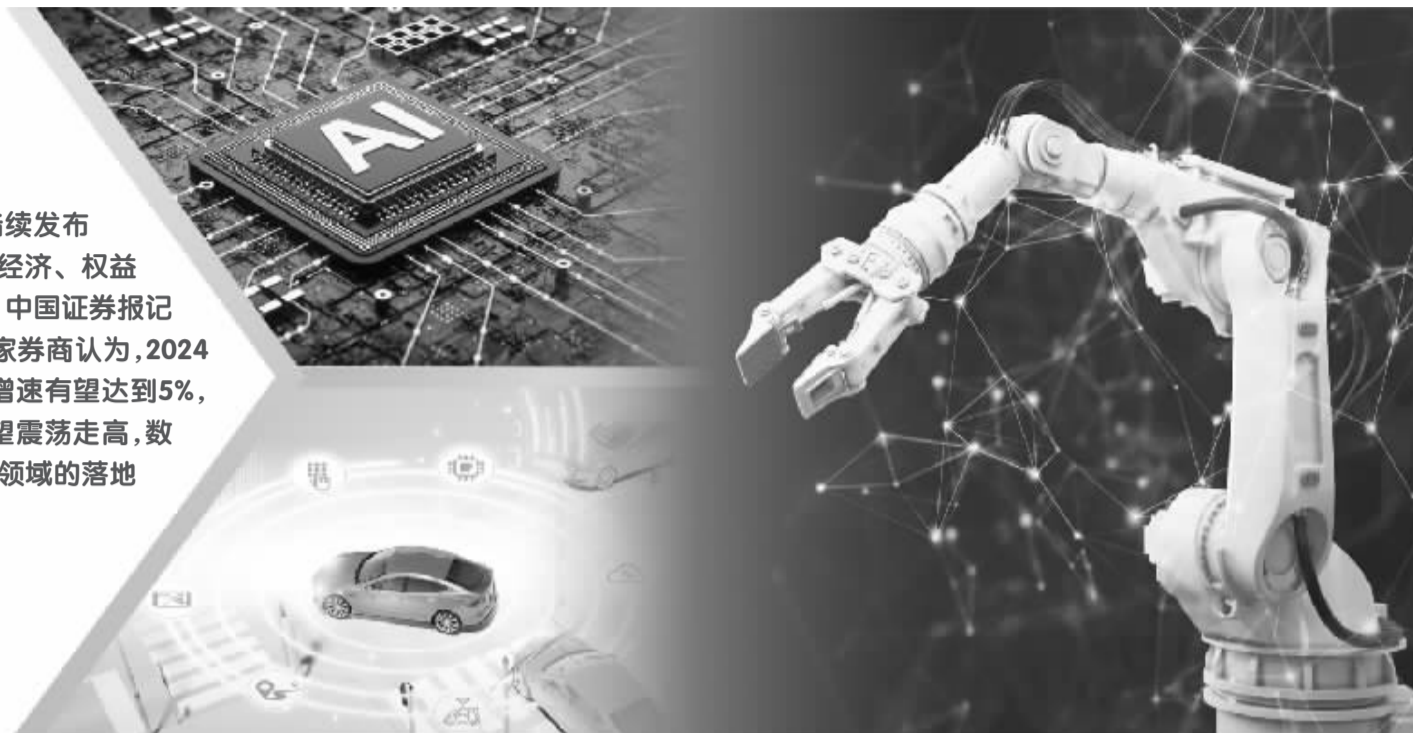
制图/苏振

近期,券商陆续发布对2024年度宏观经济、权益市场前景的预判。中国证券报记者梳理发现,多家券商认为,2024年全年我国GDP增速有望达到5%,A股在2024年有望震荡走高,数字经济、AI在垂直领域的落地和应用值得关注。