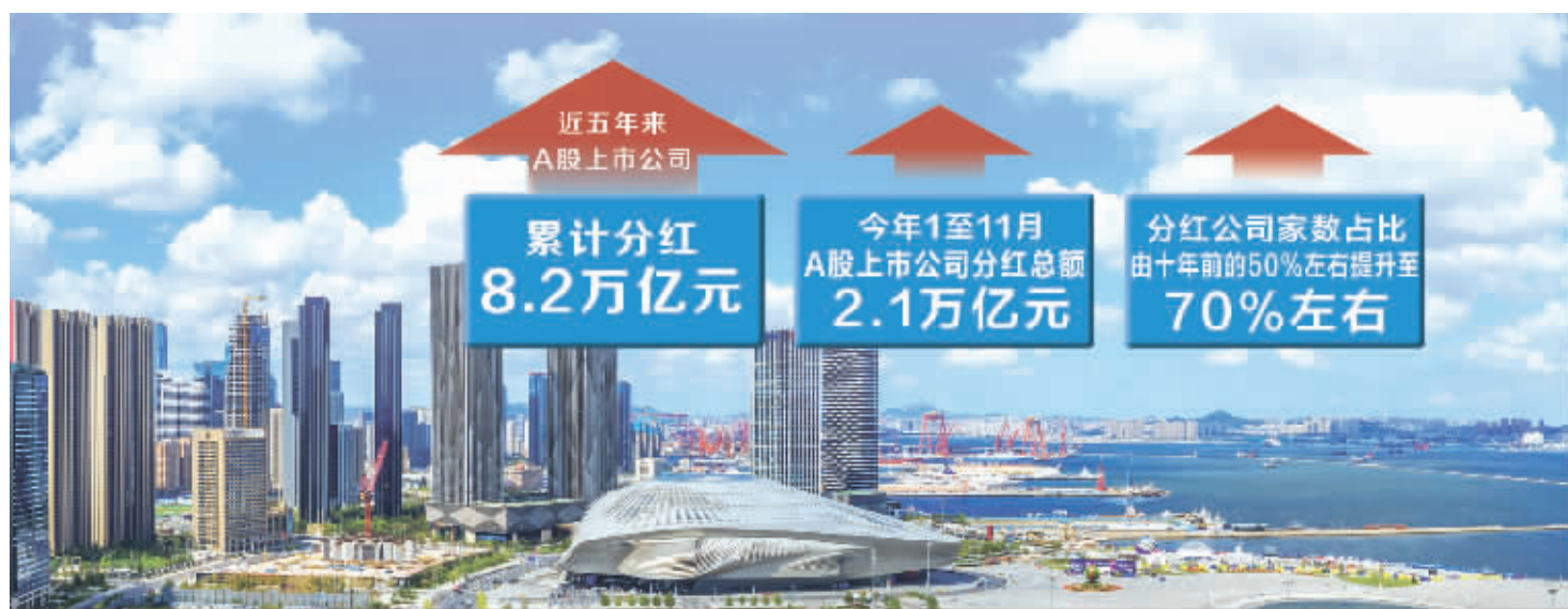
制图/韩景丰

《现金分红指引》修订内容主要有三个方面：一是进一步明确鼓励现金分红导向，推动提高分红水平。对不分红的公司加强披露要求等制度约束督促分红。对财务投资较多但分红水平偏低的公司进行重点监管关注，督促提高分红水平，专注主业。二是简化中期分红程序，推动进一步优化分红方式和节奏，鼓励公司在条件允许的情况下增加分红频次，结合监管实践，允许上市公司在召开年度股东大会审议年度利润分配方案时，在一定额度内审议批准下一年度中期现金分红条件和上限，便利公司进一步提升分红频次，让投资者更好规划资金安排，更早分享企业成长红利。（下转A02版）