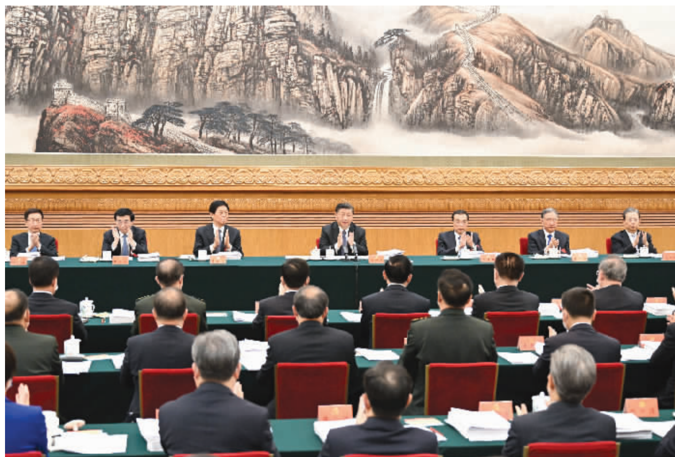
10月18日,中国共产党第二十次全国代表大会主席团在北京人民大会堂举行第二次会议。习近平、李克强、栗战书、汪洋、王沪宁、赵乐际、韩正等出席会议。

新华社北京10月18日电 中国共产党第二十次全国代表大会主席团18日下午在人民大会堂举行第二次会议。习近平同志主持会议。会议通过了将关于十九届中央委员会报告的决议