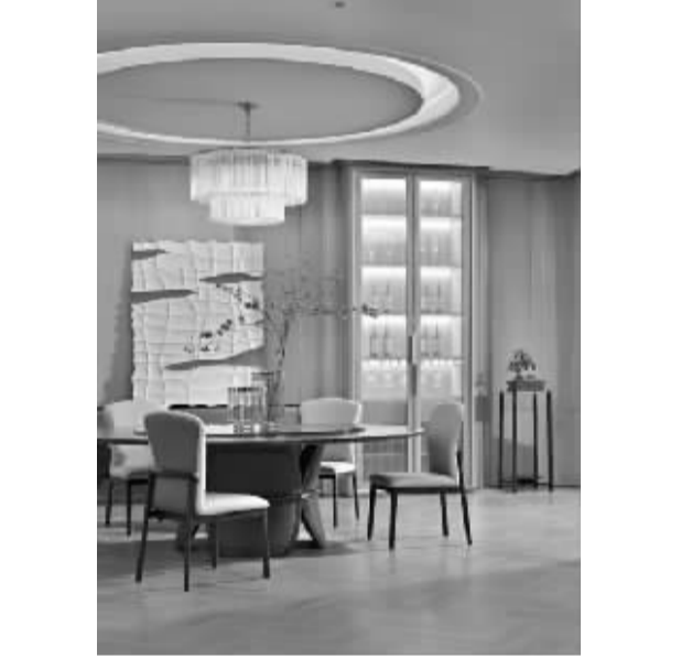
“AZ Maxform麦蜂”,简约现代风格品牌,定位为简约、年轻、现代轻奢家居生活文化代表。