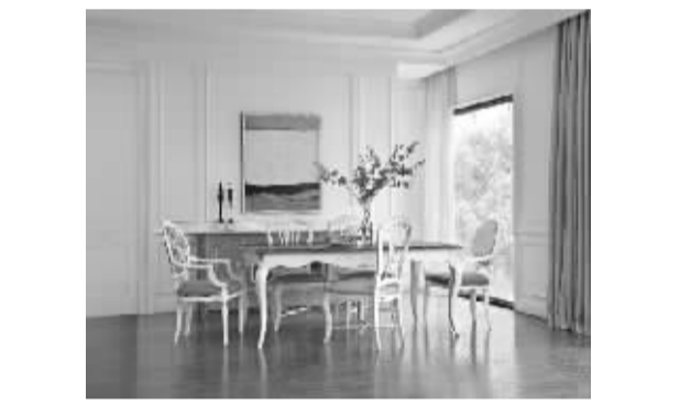
“AZ1865”-国际东方风格品牌,以国际化设计和世界先进工艺,展现中西兼容、开放大气的时尚优雅理念,覆盖中高端人群及时尚产品消费需求。