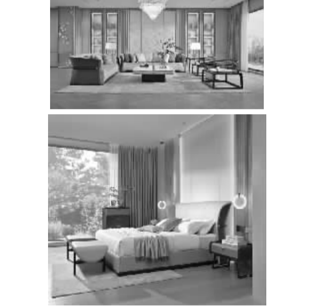
“AZ Maxform麦蜂”,简约现代风格品牌,定位为简约、年轻、现代轻奢家居生活文化代表。