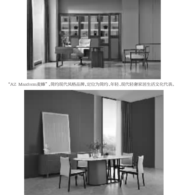
“AZ Maxform麦蜂”,简约现代风格品牌,定位为简约、年轻、现代轻奢家居生活文化代表。