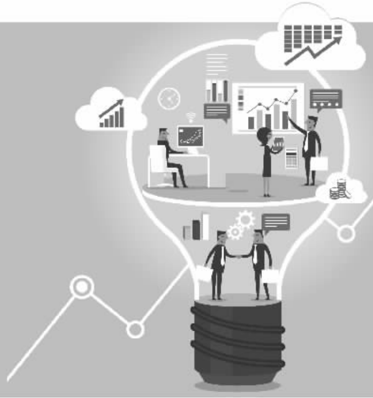
制图/杨红