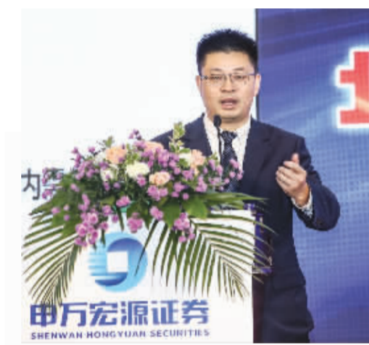
●本报记者 周璐璐 林倩

申万宏源承销保荐公司副总经理兼普惠金融总部负责人王昭凭10月15日发表主题演讲时表示,北京证券交易所(简称“北交所”)成立后,将对投行服务逻辑、企业上市逻辑、私募机构投资逻辑等方面产生深远影响。他认为,“专精特新”企业的战略机遇已获普遍认可,北交所成立之后,券商长远比拼的是投入力度和深耕程度。