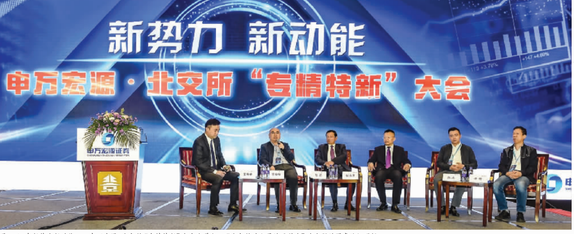
10月15日,在新势力新动能——申万宏源·北交所“专精特新”大会上举行以“北交所对公司的吸引力”为主题的圆桌论坛现场。

“专精特新”企业已经成为我国经济高质量发展的主力军。一是规模大。目前,全国有4600万户中小企业。二是贡献高。工信部数据显示,我国中小企业提供了60%以上的税收、创造了60%以上的国内生产总值,完成了70%以上的发明专利,提供了80%以上的就业岗位,占企业总数的90%以上,并容纳90%以上的新增就业。三是活力足。在中小企业中,新业态、新模式不断涌现,创新创业创造活力不断迸发。专家介绍,我国中小企业正成为构建新发展格局的有力支撑,主要体现在五个方面:独特的重要作用,较完整的产业链,超大规模国内市场,丰富的技术禀赋以及较大数量市场主体。“中小企业好,经济全局好。地方的营商环境好不好,主要看中小企业的实际感受。”专家说。作为中小企业中的“佼佼者”,“专精特新”企业受重视程度不断攀升,并已上升至国家战略层面。“专精特新”企业凸显专注、创新、活力等特征,是落实创新驱动发展战略的关键载体,也是提高产业链供应链稳定性和竞争力的坚实保障。2019年以来,工信部正式公布了两批专精特新“小巨