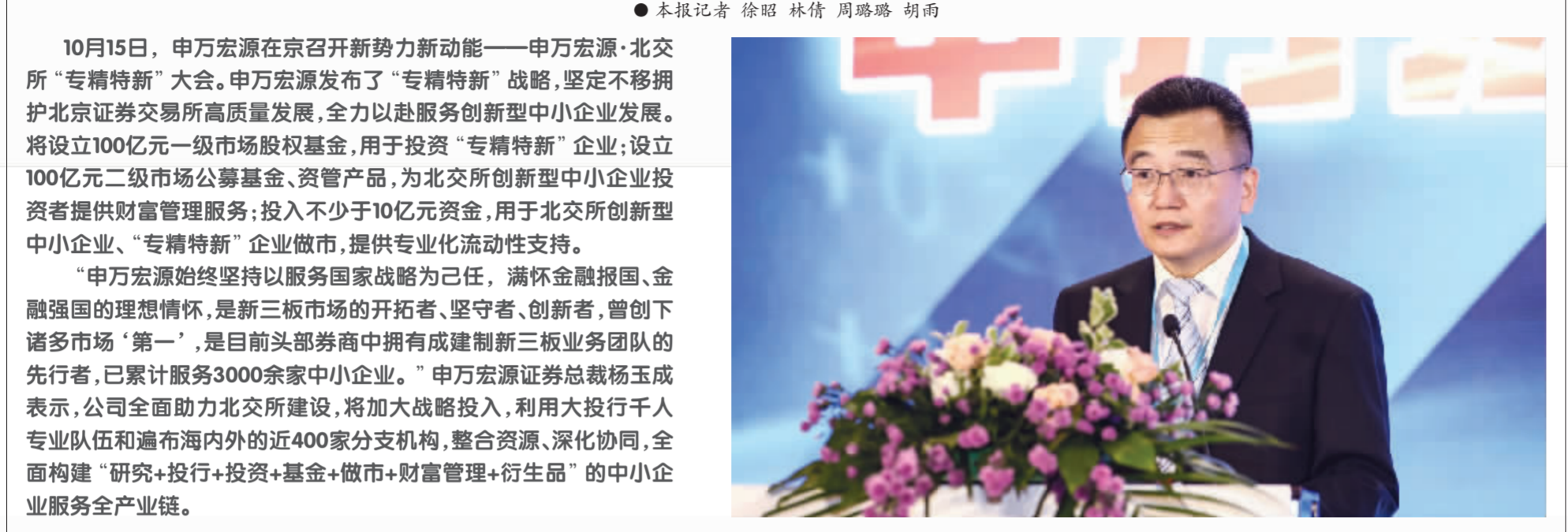
●本报记者 徐昭 林倩 周璐璐 胡雨

10月15日,申万宏源在京召开新势力新动能——申万宏源·北交所“专精特新”大会。申万宏源发布了“专精特新”战略,坚定不移拥护北京证券交易所高质量发展,全力以赴服务创新型中小企业发展。将设立100亿元一级市场股权基金,用于投资“专精特新”企业;设立100亿元二级市场公募基金、资管产品,为北交所创新型中小企业投资者提供财富管理服务;投入不少于10亿元资金,用于北交所创新型中小企业、“专精特新”企业做市,提供专业化流动性支持。“申万宏源始终坚持以服务国家战略为己任,满怀金融报国、金融强国的理想情怀,是新三板市场的开拓者、坚守者、创新者,曾创下诸多市场‘第一’,是目前头部券商中拥有建成制新三板业务团队的先行者,已累计服务3000余家中小企业。”申万宏源证券总裁杨玉成表示,公司全面助力北交所建设,将加大战略投入,利用大投行千人专业队伍和遍布海内外的近400家分支机构,整合资源、深化协同,全面构建“研究+投行+投资+基金+做市+财富管理+衍生品”的中小企业服务全产业链。