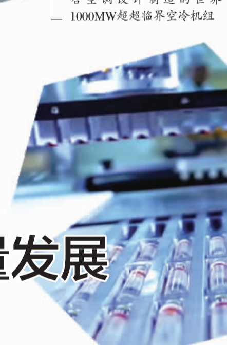
通化东宝重组人胰岛素生产线