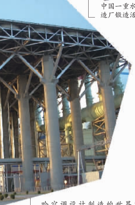
哈空调设计制造的世界首套1000MW超超临界空冷机组