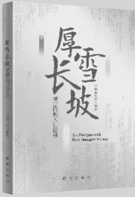
出版社：新华出版社 作者：中国证券报 书名：《厚雪长坡：财富管理人访谈录》

如何在充满不确定的世界里，培育确定的价值回报预期？由中国证券报编著的《厚雪长坡——财富管理人访谈录》，或将多维呈现种种可能。