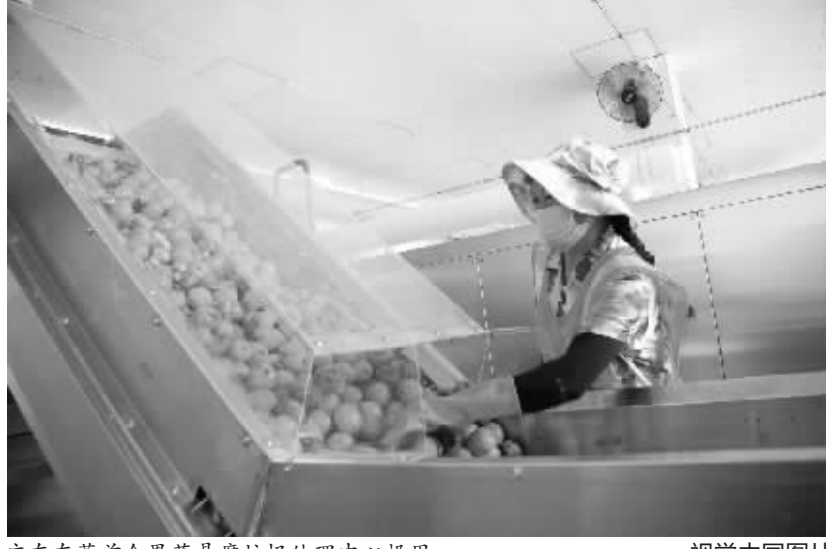
广东东莞首个果蔬易腐垃圾处理中心投用

威保特表示,随着社会经济的快速增长,环境保护提升到前所未有的高度,环保行业进入全面深耕时期。2011年至2018年,我国生活垃圾清运量从1.64亿吨增长至2.28亿吨。其中,填埋无害化处理量从1.06亿吨增长至1.17亿吨,体量较为庞大;垃圾分类政策陆续出台,以及全国范围开展环保督察,体现了我国对垃圾分类和妥善处置的高度重视。日益增加的垃圾无害化处理