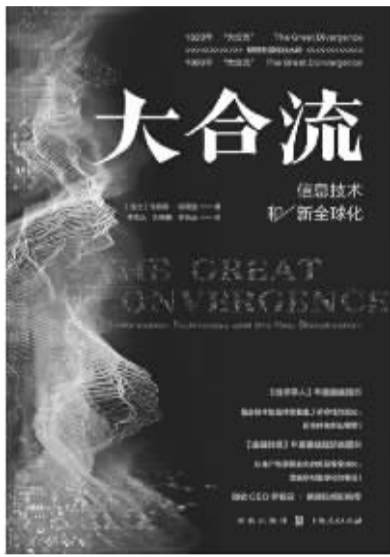
书名:《大合流:信息技术和新全球化》 作者:[瑞士]理查德·鲍德温 出版社:上海人民出版社