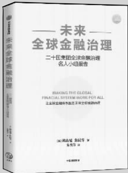
出版社：中信出版集团 作者：靳尚达曼 朱民等 书名：《未来全球金融治理》