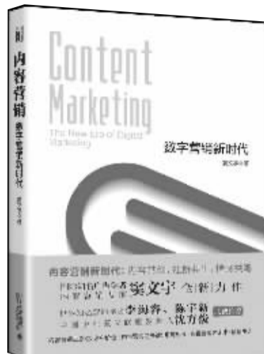
书名：《内容营销：数字营销新时代》 作者：窦文宇 出版社：北京大学出版社