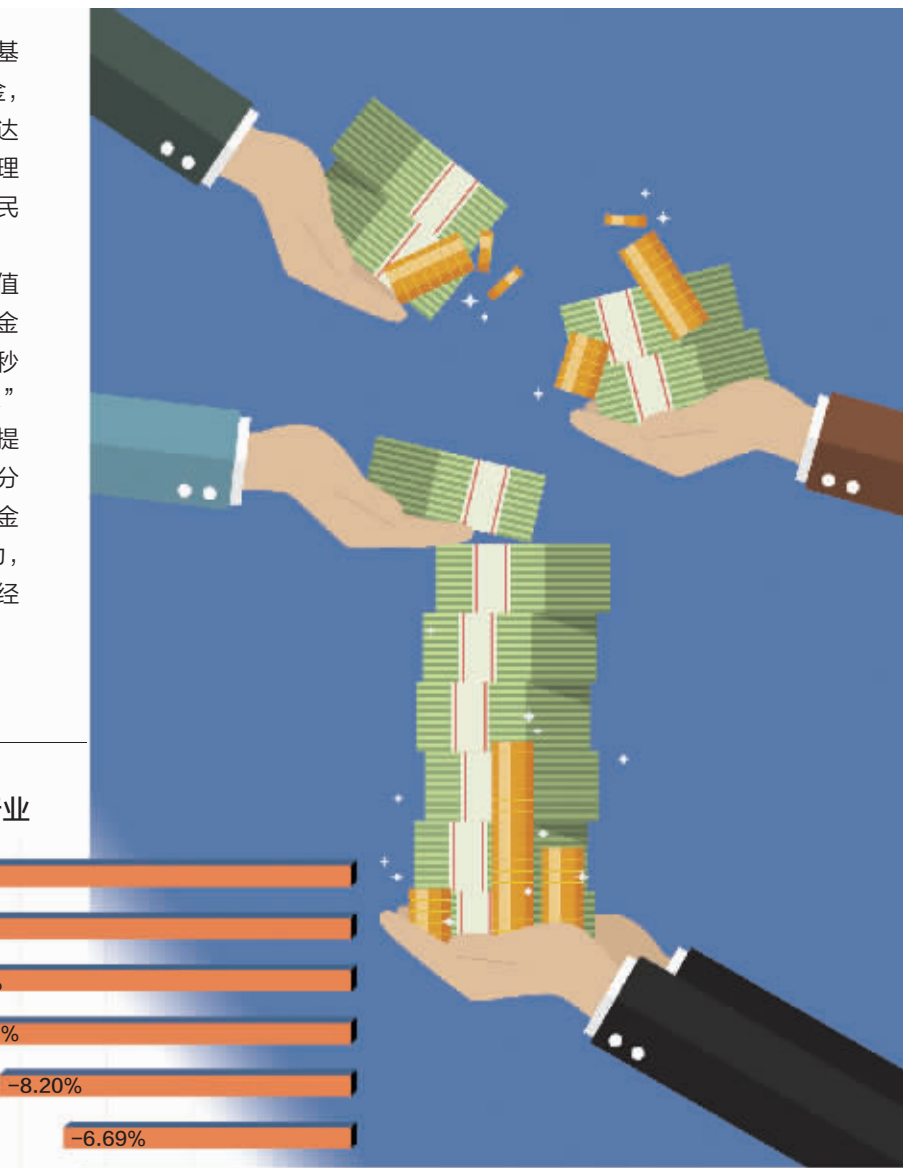
视觉中国图片 数据来源/Wind 制图/王春燕

在广东读研的小陈同学,从去年10月开始买基金,现在手握三十二只基金,主要是消费、新能源、军工类基金,将热门行业基金一网打尽,最高的时候收益率19%。不过,当大跌突如其来,尽管把鸡蛋放到了32个篮子里,小陈的风险却并没有降低。最近,他持仓的基金多半都在下跌,已经把去年的收益跌完了。