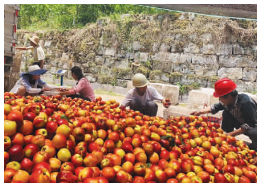
在中国进出口银行的支持下，重庆市云阳县渠马镇进进村建起了桃园，村民正在打色刚刚摘下的桃子。

使命，最大力度加大扶贫信贷投入，助力贵州脱贫攻坚成效显著。中国农业发展银行新疆分行集全行之智、全行之力，全力服务脱贫攻坚。累计发放扶贫贷款1985.7亿元，辐射全疆14个地（州、市）、72个县（市、区），带动贫困人口198.15万人次。中国农业发展银行山西吕梁市分行创新政企三方合作，破解产业扶贫僵局。三方面释放带动效应，扩大金融扶贫作用。中国农业发展银行广西隆林各族自治县支行首创“四融一体”扶贫模式，践行“四级联动”运作机制，助推隆林县8.67万贫困人口、97个贫困村顺利脱贫，彻底摘除隆林人民的“穷穷帽”。（戴安琪）