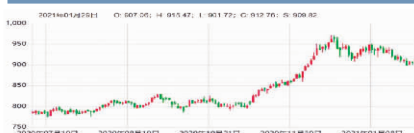
易盛农产品期货价格系列指数(郑商所)(1月29日)