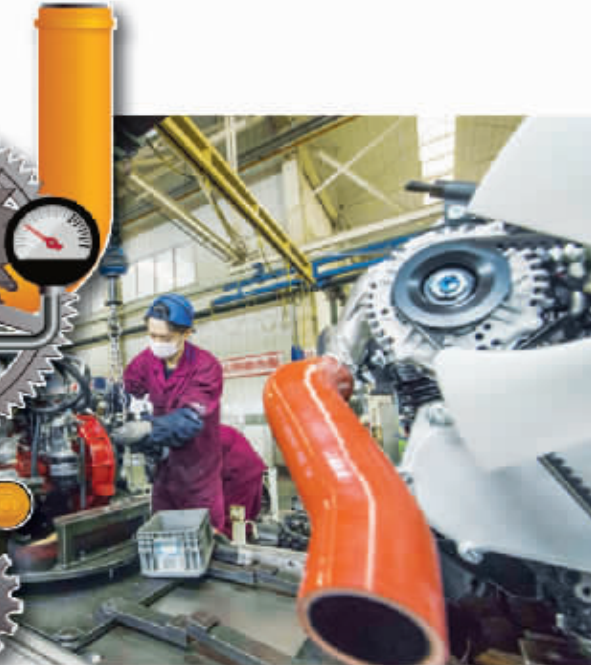
新华社图片 数据来源/国家统计局 制图/刘海洋