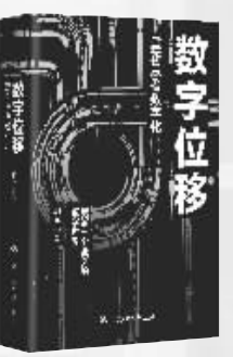
作者：胡泳 出版社：中国人民大学出版社 内容简介： 20世纪90年代以来,数字和通信技术的发展带来以互联网、移动互联网、大数据、人工智能、5G为标志的一系列变革,颠覆了生产和商业的运行方式以及人们的生活和思维方式。今天,数字科技正在进一步加速一个全新的数字世界的出现,我们正处于另一次大变革的前夜。 作者简介： 胡泳,政治学博士,北京大学新闻与传播学院教授。致力于在文化、技术和政治的交叉点中发现有趣的东西,特别是解放性的文化实践、网络和网络社会理论、数字经济与管理,以及人的主体性。