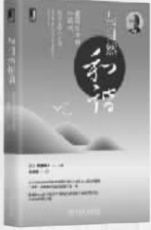
作者：【日】稻盛和夫 出版社：机械工业出版社 内容简介： 现代文明何时将以何种形式崩塌?未来等待我们的将是怎样的世界?过去的文明在地球环境的变化中经历了怎样的兴亡?环境变化会对人类的生理、心理和行为方式产生怎样影响?它与政治、经济活动的变化又有着怎样的关联?本书针对以上问题提出了对策与方案。 作者简介： 稻盛和夫,1959年创办京都陶瓷株式会社,1984年创办第二电信株式会社。2010年出任日本航空株式会社会长,仅一年就让破产重建的日航大幅扭亏为盈,并创造日航历史上最高的利润。