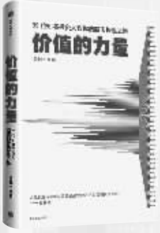
作者：雪球 出版社：中信出版集团 内容简介： 本书集结李迅雷、但斌、洪流、林园、李大霄、张居营等39位颇具影响力的投资人、明星基金经理和投资达人的投资智慧,涉及价值投资、量化投资、成长趋势投资、指数投资、行业板块等领域,分享了独特的投资逻辑和理念,以及选股方法和成功投资的秘诀。 作者简介： 雪球,投资者在线交流社区,包括个人投资者、上市公司管理者,以及券商、基金、保险和私募机构从业人员。