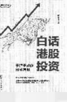
作者：范俊青 出版社：清华大学出版社 内容简介： 这是一本港股投资书,它从一个普通人投资港股的视角,用大白话手把手结合具体案例教会读者为什么要投资港股以及如何投资港股。 作者简介： 范俊青,70后”投资者,雪球网活跃用户,文章总阅读量超过1600万。有20年股票投资经历,2013年开始投资港股,历经港股起起伏伏,2016年后将大部分资金用于港股投资。