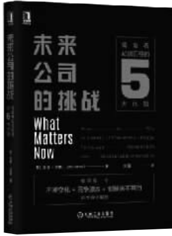
书名：《未来公司的挑战》 作者：【美】加里·哈默 出版社：机械工业出版社