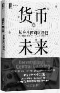
作者：【黎】赛费迪安·阿莫斯 出版社：机械工业出版社 内容简介： 本书第一部分解释了货币,包括货币的功能和性质。第二部分讨论了历史上曾经出现的健全和不健全的货币形式对个人、国家和整个人类社会的影响。第三部分解释了比特币网络的运行方式以及比特币最为突出的经济学特征,分析了比特币作为一种健全货币形式的可能性。 作者简介： 赛费迪安·阿莫斯,区块链专家,奥地利经济学派研究者,比特币经济学研究开创者。