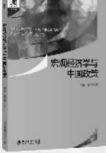
作者：颜色 郭凯明 出版社：北京大学出版社 内容简介： 本书全面覆盖了当代宏观经济学主要概念、理论与模型,系统总结了中国经济的核心数据、政策与事实,内容分为实体经济数据、经济增长理论、货币和通货膨胀、经济波动理论与开放宏观经济共五个部分。 作者简介： 颜色,北京大学光华管理学院副教授、北京大学经济政策研究所副所长。研究领域为宏观经济学、中国经济和经济史。郭凯明,中山大学岭南学院副教授,研究领域为产业转型、经济增长、人口发展与中国宏观经济。