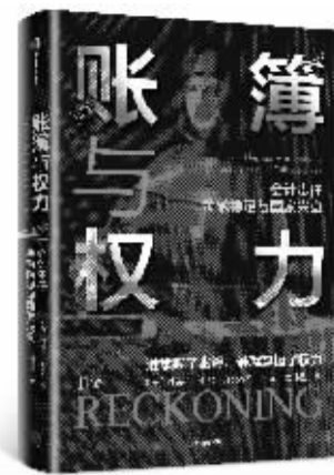
书名:《账簿与权力》 作者:[美]雅各布·索尔 出版社:中信出版集团