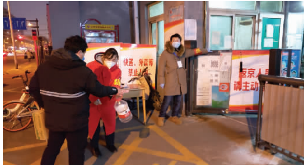
北京银行员工支援社区,为住户测量体温并核出入证。

服务国家战略,业务网点和经营布局持续优化。 聚焦首都城市总体规划实施和实体经济发展重点领域,全力服务北京“四个中心”功能建设、城市副中心建设等重大区域战略,北京地区贷款较2019年初增长673亿元,增幅11.6%,北京地区市场份额进一步提升。积极参与京津冀协同发展、长三角一体化、粤港澳大湾区等重大国家战略,持续完善区域布局,宁波分行、南通分行获批开业,截至2020年一季度末,在全国范围内设立一级分行14家,二级分行12家,