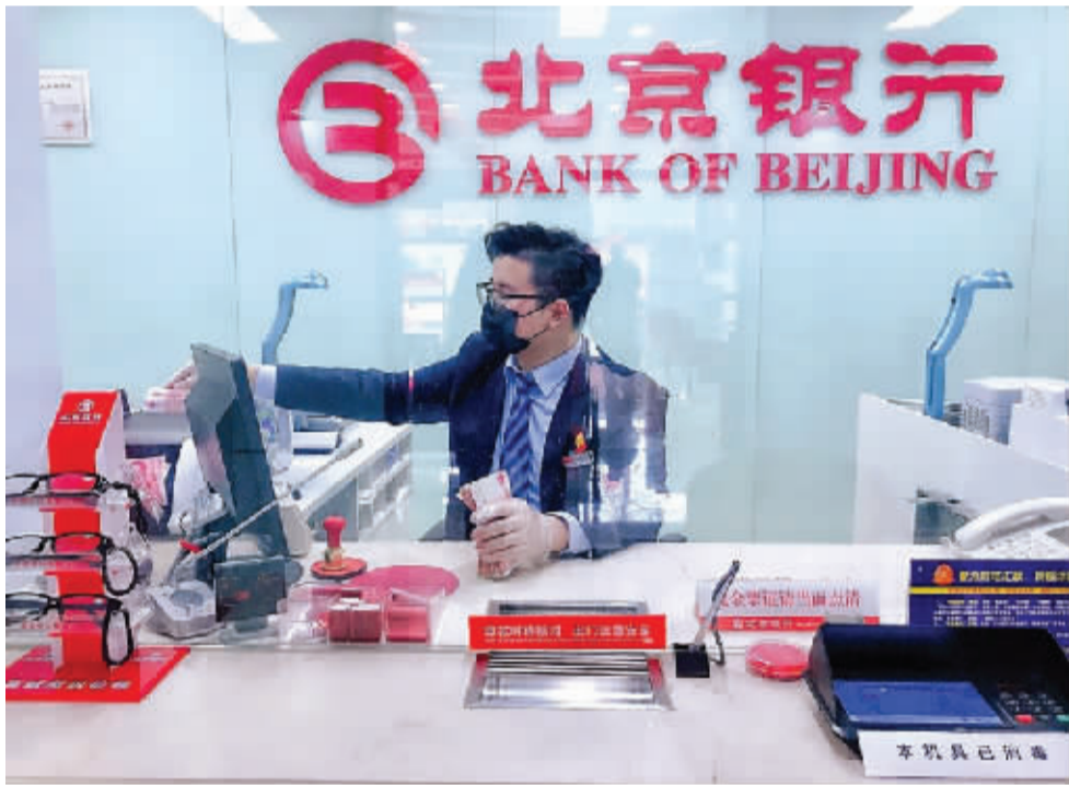
在疫情防控的重要阶段,北京银行全力保障各网点运营,为客户提供高品质服务。

重视普惠金融,小微业务和惠民服务倍受赞誉。 2019年末,普惠小微贷款余额637亿元,增幅26.52%,高出全行贷款增速11.89个百分点;普惠小微户数突破2万户,较年初增加1834户。发放支小再贷款1112笔、金额37亿元,加权平均利率4.26%,有效支持北京地区小微企业复工复产。入选人行营管部“京创通”首批6家试点银行,托管全国首只地方“纾困基金”,创新推出转贷款业务,为经济社会发展的