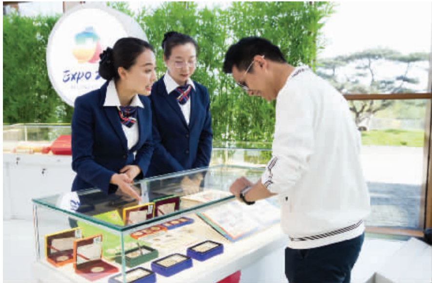
北京银行员工在世博会现场提供金融服务。