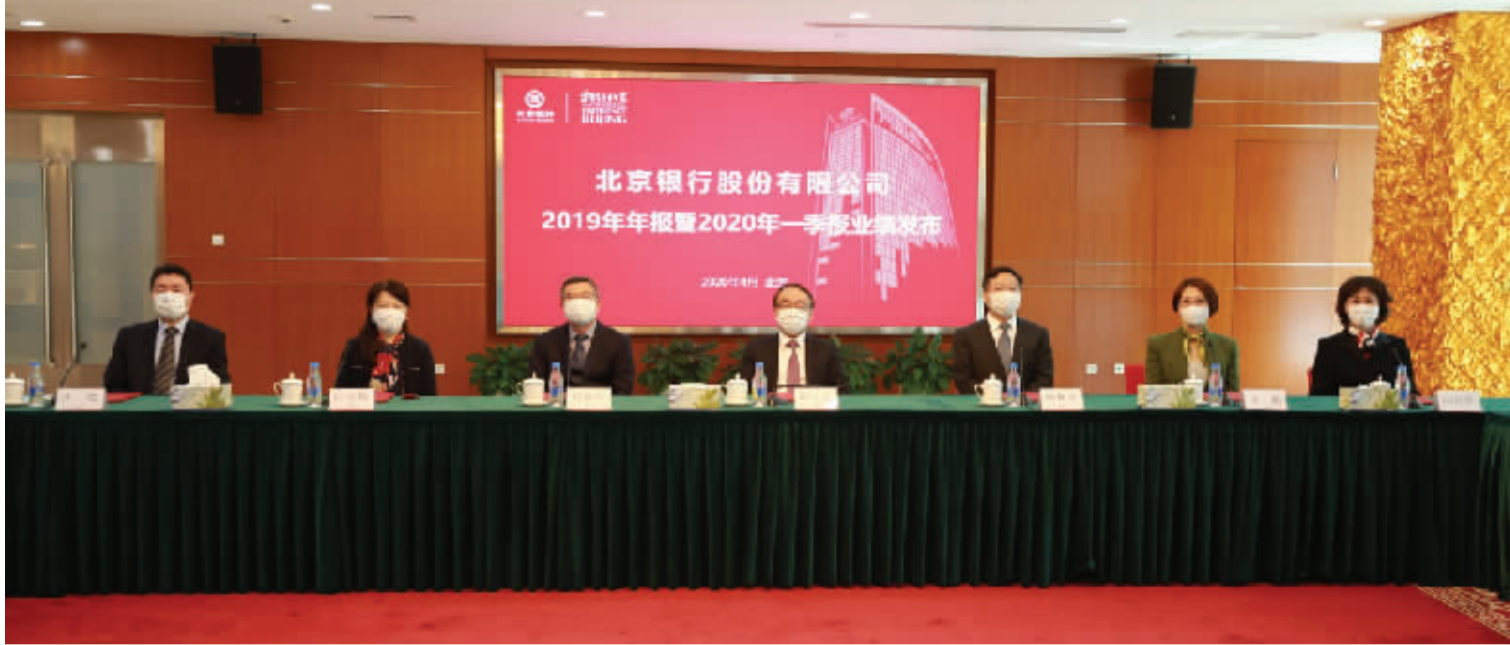
2020年4月27日,北京银行发布2019年年报及2020年一季度报。