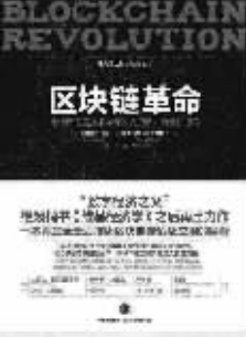
作者：【加】唐塔普斯科特 【加】亚力克斯·塔普斯科特 出版社：中信出版社 内容简介：

本书内容源自投资2600多万元的前沿研究项目、100多场与多国政治界、学术界和工商界的翘楚人物对话;前瞻性揭示区块链对银行、证券、保险等行业产生的深远影响。