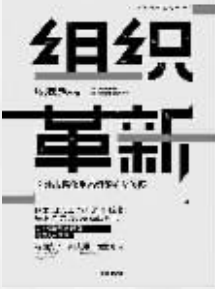
作者：杨国安 出版社：中信出版社 内容简介：

传统的等级组织已经跟不上时代,各种新型组织形式正在出现,比如合弄制、敏捷型、网络型、平台型、无边界组织等,但领导者真正需要知道的是,什么才是有效的。