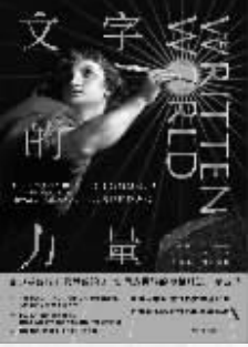
作者：【美】马丁·普克纳 出版社：中信出版集团 内容简介：

《文字的力量》从4000多年的世界文学中挑选出16部尤为重要的经典作品,有《伊利亚特》《源氏物语》《共产党宣言》等,让我们看到文字如何塑造哲学、宗教、政治与文明。