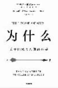
作者：【美】朱迪亚·珀尔 【美】达纳·麦肯齐 出版社：中信出版社 内容简介：

作者在本书中回答的核心问题是:如何让智能机器像人一样思考?借助因果关系之梯的三个层级逐步深入地揭示因果推理的本质,并据此构建出相应的自动化处理工具和数学分析范式,作者给出了一个肯定的答案。