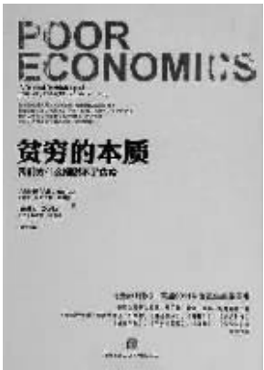
书名：《贫穷的本质》 作者：阿比吉特·班纳吉 埃斯特·迪弗洛 出版社：中信出版社