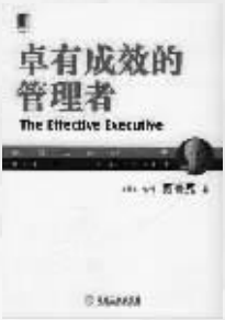
作者：【美】彼得·德鲁克 出版社：机械工业出版社 内容简介：

德鲁克根据多年的观察,提出“并不是只有高级管理人员才是管理者,每一位知识工作者其实都是管理者,即使他没有所谓的职权,只要他能为组织做出突出的贡献。”