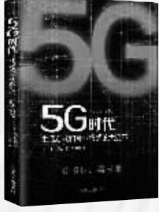
作者：【日】龟井卓也 出版社：浙江人民出版社 内容简介：

对工业界来说,5G远不止于高速移动互联网,它被寄予了更大的厚望,它要成为支持下一代核心高科技的“基建”技术。这些“高科技”,包括无人驾驶、人工智能乃至宏观的“智慧城市”。