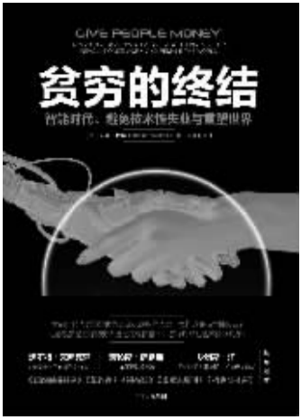
书名:《贫穷的终结》 作者: [美] 安妮·罗瑞 出版社: 中信出版集团