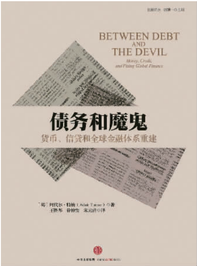
出版社：中信出版集团 作者：【英】阿代尔·特纳 书名：《债务和魔鬼》

第一是投机型债务引发资产泡沫。银行信贷有很大一部分并没有支持新的投资，而很有可能用来追逐现有的资产，也就是用信贷来进行投机，这就会促使资产价格不断升高。美联储主席鲍威尔在一次演讲中指出，“从历史上看，当资产价格飙升至远高于标准基准时，会有规律性地大幅下跌，而这些下跌可能会带来经济上的痛苦，远远超出直接参与投机热潮投资者的范围。”