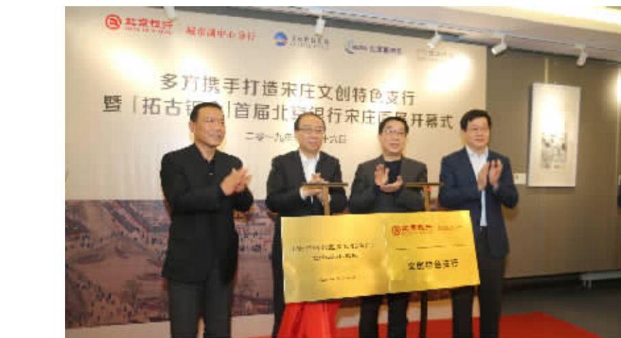
2019年1月26日,北京银行设立宋庄文创特色支行,携手多方助力城市副中心文化产业发展。

——金融市场业务坚持“回归本源”、“两高一轻”,持续提升对实体经济和国家重大战略的服务能力,经营效能稳步提升。聚焦“一带一路”建设,积极打造“丝路汇通”品牌,国际业务表内资产规模达到882亿元,新增外币债券及结构性投资规模同比增幅178%;自贸区外汇贷款规模在所有开办上海自贸区业务的28家中资银行中排名第6。入选人行营管部“京创通”首批6家试点银行,托管全国首只地方“纾困基金”,创新推出转贷款业务,全力助推民营经济和小微企业发展。截至6月末,托管、信用证、结售汇、福费廷、票据转贴现、黄金、债券借贷等金融市场轻资本业务实现中收同比增幅24.8%。拓展基金投资业务,实现分红收入近10亿元。货币市场交易总量达到8.75万亿元,同比增长86%。扩大负债来源,同业负债加权成本较年初下降78BP,同比下降99BP。获得人民币外汇即期尝试做市商、全国银行间同业拆借中心同业存款