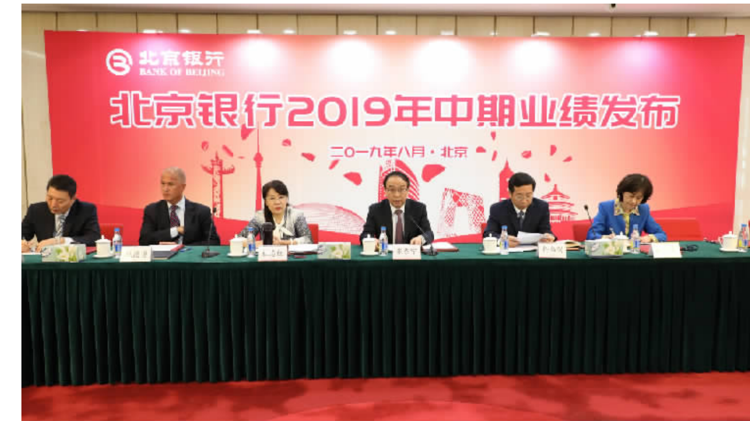
2019年8月27日,北京银行发布2019年中期业绩。

重大战略,大力支持城市副中心职工集体土地项目、新机场线等一大批重点项目。作为仅有的合作金融机构,全力做好世园会综合金融服务,在园区内设立金融服务站,代销世园会特许贵金属产品,独家发行世园会主题银行卡,注册全国首单世园债,成功举办世园会北京银行主题日活动,累计支持世园会公司客户140余户,支持世园会建设贷款余额5.5亿元。宁波分行、南通分行相继开业,全行开业分支机构达到661家,服务覆盖范围更趋完善。各外埠分行立足当地、强化特色,积极服务区域经济建设,如杭州分行全力推进科技金融“百凤千鹰”行动计划、南昌分行深挖江西丰富旅游资源推出智慧旅游卡,在全国各个区域进一步擦亮了北京银行的服务品牌。