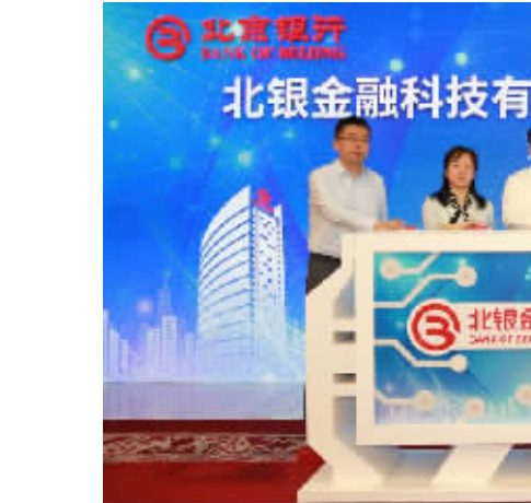
2019年5月16日,北京银行深耕金融科技前沿,设立北银金融科技子公司。

运营能力和客户体验持续提升,手机银行结算交易量同比增长44%,月活客户数同比增长90%。把握ETC业务发展契机,业内首家与北京速通公司合作实现ETC跨区域办理,业务范围覆盖至全国。推出信用卡线上分期产品“i易贷”,创新“悦行