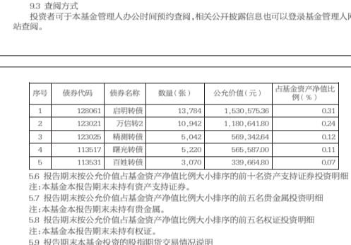
注: 本基金业绩比较基准为: 中证100指数收益率*95%+一年期银行定期存款利率(税后)*5%。业绩比较基准在每个交易日实时进行调整。

本基金在报告期内严格按照基金合同约定的投资范围、投资策略及资产配置比例进行投资。本基金投资于股票资产占基金资产净值的比例符合基金合同的约定。本基金投资于债券资产占基金资产净值的比例符合基金合同的约定。本基金投资于权证资产占基金资产净值的比例符合基金合同的约定。本基金投资于衍生品资产占基金资产净值的比例符合基金合同的约定。本基金投资于其他资产占基金资产净值的比例符合基金合同的约定。