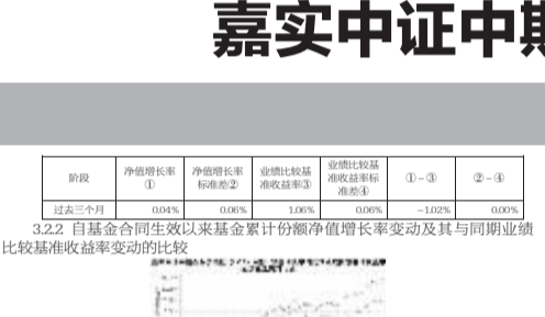
图1:嘉实中证中期企业债指数(LOF)基金份额累计净值增长率与同期业绩比较基准收益的比较